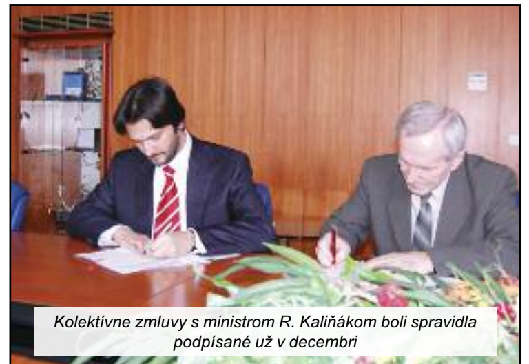
Kolektívne zmluvy s ministrom R. Kaliňákom boli spravidla podpísané už v decembri

29. januára asi šesťsto jeho členov v oranžových vestách OZP zabralo priestranstvo v blízkosti Bratislavského hradu, priamo pod budovou Národnej rady SR, aby tak vyjadrilo nesúhlas s návrhom skupiny poslancov na odvolanie ministra vnútra SR Roberta Kaliňáka v súvislosti so spo-