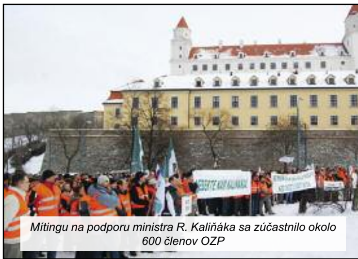
Mítingu na podporu ministra R. Kaliňáka sa zúčastnilo okolo 600 členov OZP