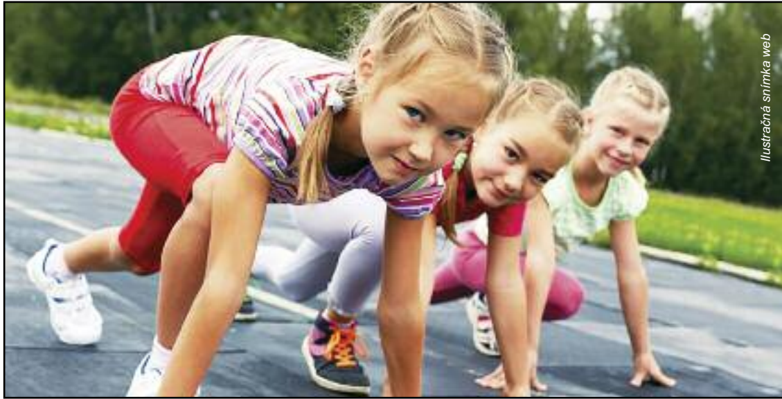
Ilustračná snímka web

ný čas, ak jeho pracovný pomer u zamestnávateľa trvá nepretržite najmenej 24 mesiacov.