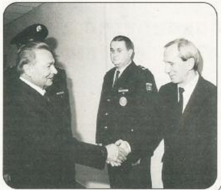
Jediný prezident republiky, ktorý sa stretol s predsedom OZP na policajnej pôde, bol Rudolf Schuster, svedčí o tom aj článok v POLÍCII 11/2003.