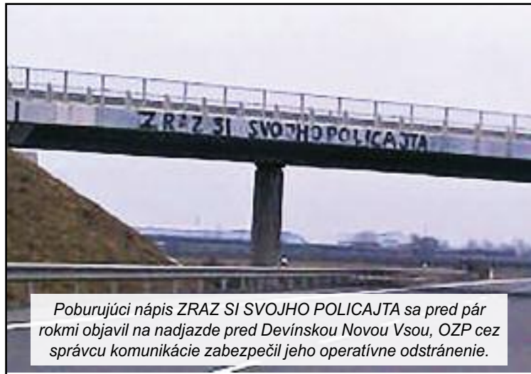
Poburujúci nápis ZRAZ SI SVOJHO POLICAJTA sa pred pár rokmi objavil na nadjazde pred Devínskou Novou Vsou, OZP cez správcu komunikácie zabezpečil jeho operatívne odstránenie.