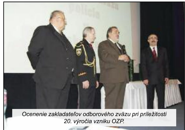
Ocenenie zakladateľov odborového zväzu pri príležitosti 20. výročia vzniku OZP.

Predseda vlády V. Mečiar na 4. júla 1997 zvolal služobný aktív krajských a okresných riaditeľov PZ, na ktorom sa bez pozvania zúčastňuje aj vedenie OZP. Predseda vlády verejne sľubuje nezníženie rozpočtu na rok 1998 a splnenie aj ďalších požiadaviek policajných odborov. Na základe verejného prísľubu predsedu vlády SR policajné odbory dňa