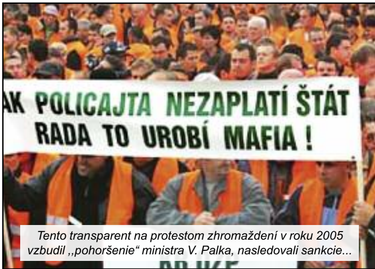
Tento transparent na protestnom zhromaždení v roku 2005 vzbudil „pohoršenie“ ministra V. Palka, nasledovali sankcie...

Poslanci NR SR schvaľujú diskriminačnú novelu zákona o štátnej službe, ale našťastie prezident Ivan Gašparovič novelu zákona nepodpíše a vracia poslancom. Lobing OZP a následný rozpad koalície spôsobuje, že poslanci už nie sú schopní prelomiť prezidentovo veto a novelu opätovne neschvaľujú.