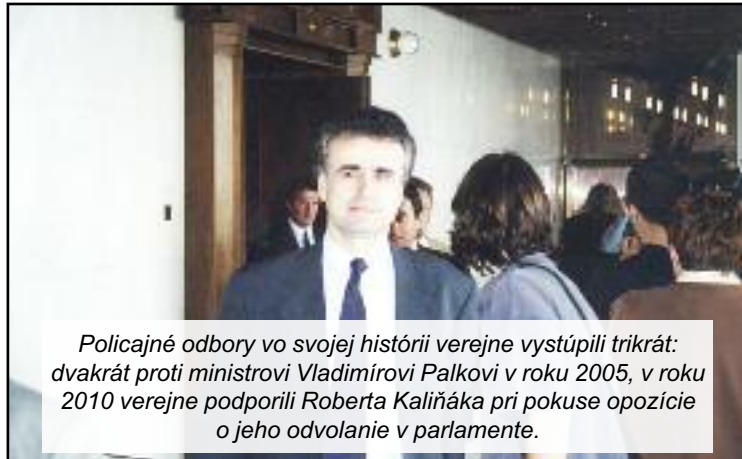
Policajné odbory vo svojej histórii verejne vystúpili trikrát: dvakrát proti ministrovi Vladimirovi Palkovi v roku 2005, v roku 2010 verejne podporili Roberta Kaliňáka pri pokuse opozície o jeho odvolanie v parlamente.

Kaliňák, poznajúc problémy rezortu z predchádzajúcej funkcie predsedu Výboru pre obranu a bezpečnosť NR SR, pri plnom rešpektovaní postavenia OZP ako sociálneho partnera a korektnej spolupráci s ním personálne a materiálne stabilizuje Policajný zbor. V rekordne krátkom čase prijíma zásadné rozhodnutia v kariérnom postupe a vzdelávaní policajtov a zásadným spôsobom