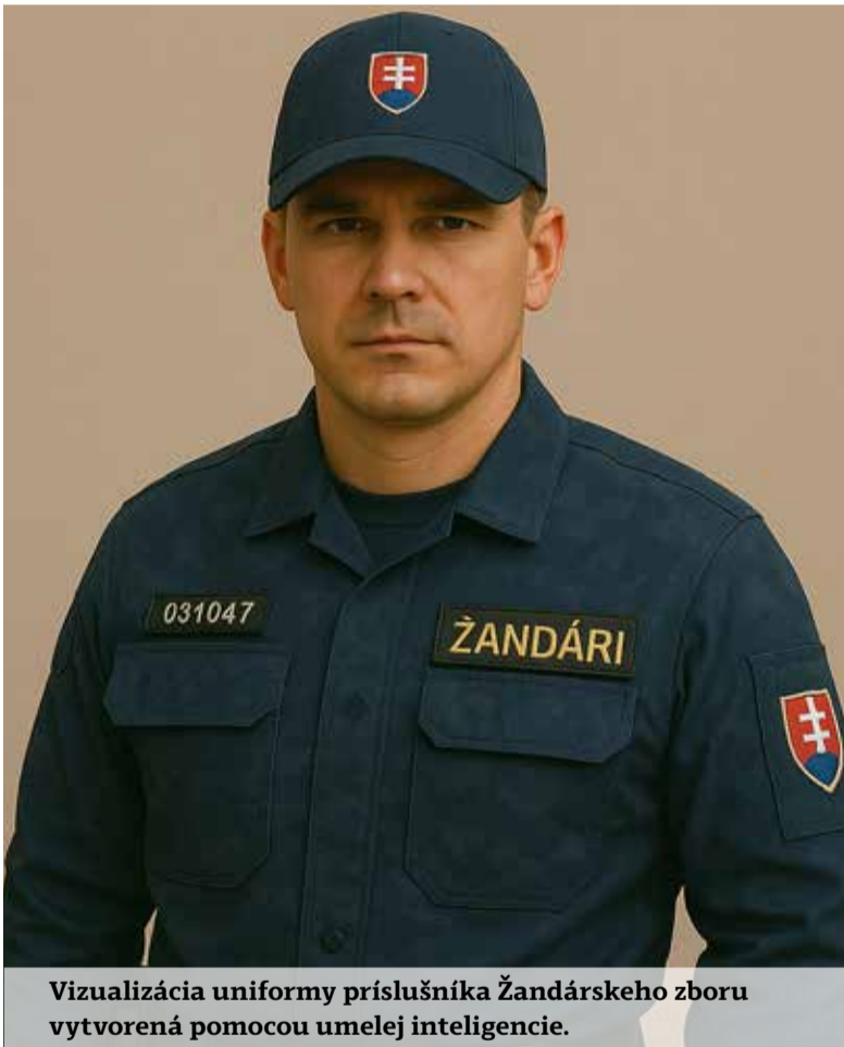
Vizualizácia uniformy príslušníka Žandárskeho zboru vytvorená pomocou umelej inteligencie.

Odborový zväz polície v SR patril medzi kritikov tejto novely v tej časti, ktorá sa týkala policajtov. Navrhovali vypustiť možnosť zapojenia policajtov do Žandárskeho zboru z dôvodu, že nebolo jasné velenie a prepojenie polície