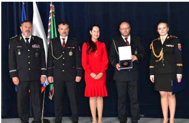
Slávnostné udeľovanie rezortných vyznamenaní.

Na slávnosti sa zúčastnili významní hostia z domáceho i zahraničného prostredia – minister vnútra Matúš Šutaj Eštok, prvá štátna tajomníčka Lucia Kurilovská, štátny tajom-