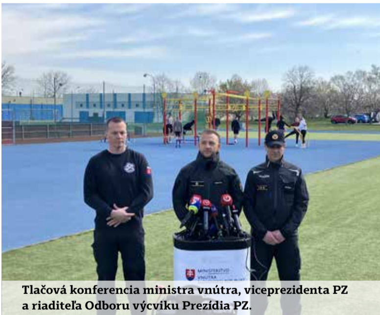
Tlačová konferencia ministra vnútra, viceprezidenta PZ a riaditeľa Odboru výcviku Prezídia PZ.