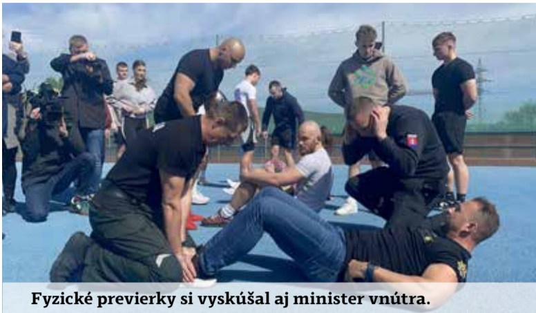
Fyzické previerky si vyskúšal aj minister vnútra.

prešiel aj systém hodnotenia – uchádzači už nemôžu zlyhať v jednej disciplíne a dohnať to výkonom v iných. Po novom musia dosiahnuť požadovanú minimálnu úroveň pri všetkých štyroch testoch. Ak neuspjú, môžu previerky opakovať po dvojmesačnej prestávke.