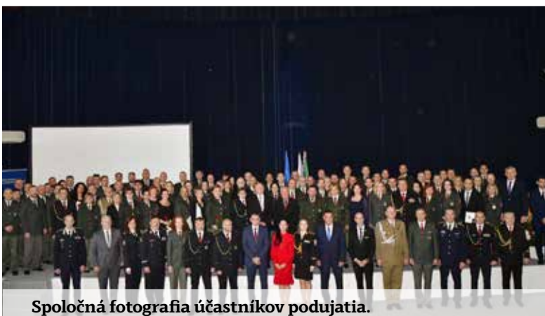
Spoločná fotografia účastníkov podujatia.

Odbornosť, stabilita a medzinárodná dôvera