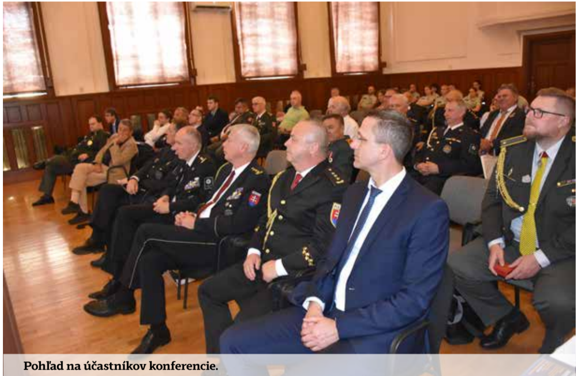
Pohľad na účastníkov konferencie.