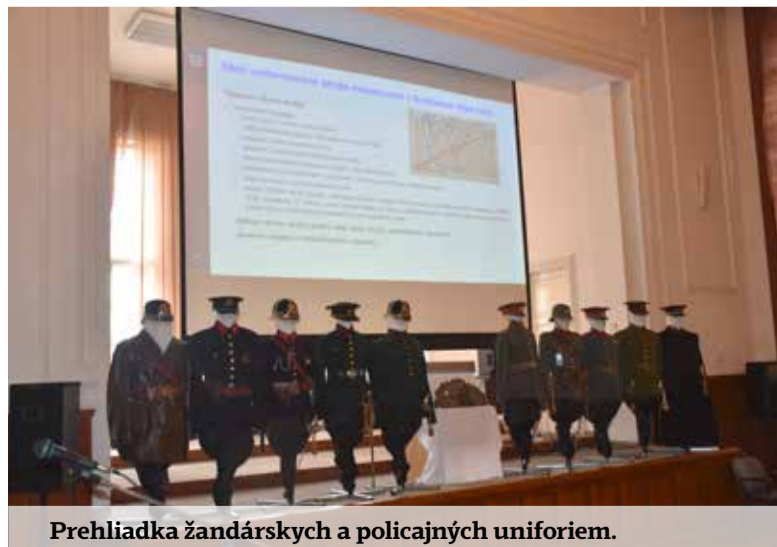
Prehliadka žandárskych a policajných uniformiem.

Okrem samotných prednášajúcich a nadšencov policajnej histórie sa konferencie zúčastnili aj študenti Strednej odbornej školy Policajného zboru v Pezinku, pre ktorých bola účasť príležitosťou nahliadnuť do historických súvislostí svojej budúcej profesie a stretnúť sa s odborníkmi z praxe aj výskumu. Žiaľ, vzde-